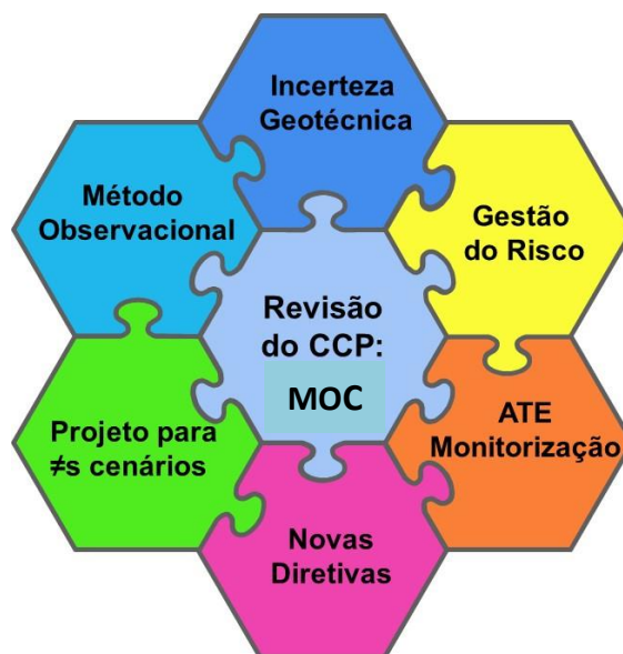
Figura 1 – Aplicação das MOC nas OGC

Modificações Objetivas do Contrato (MOC) na resolução das situações previsivelmente incertas que poderão ocorrer durante a execução da obra: